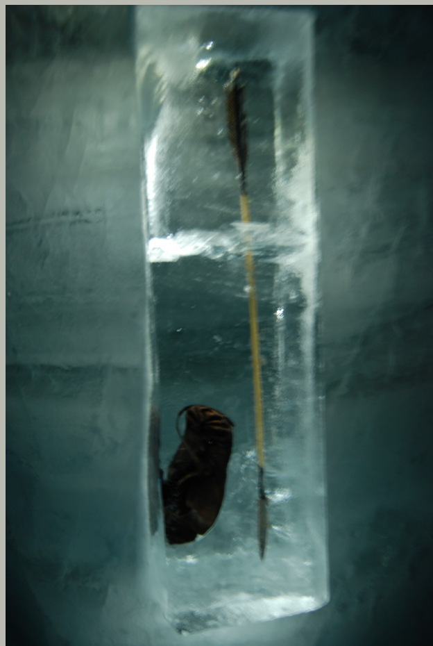
Foto av istunnelen.